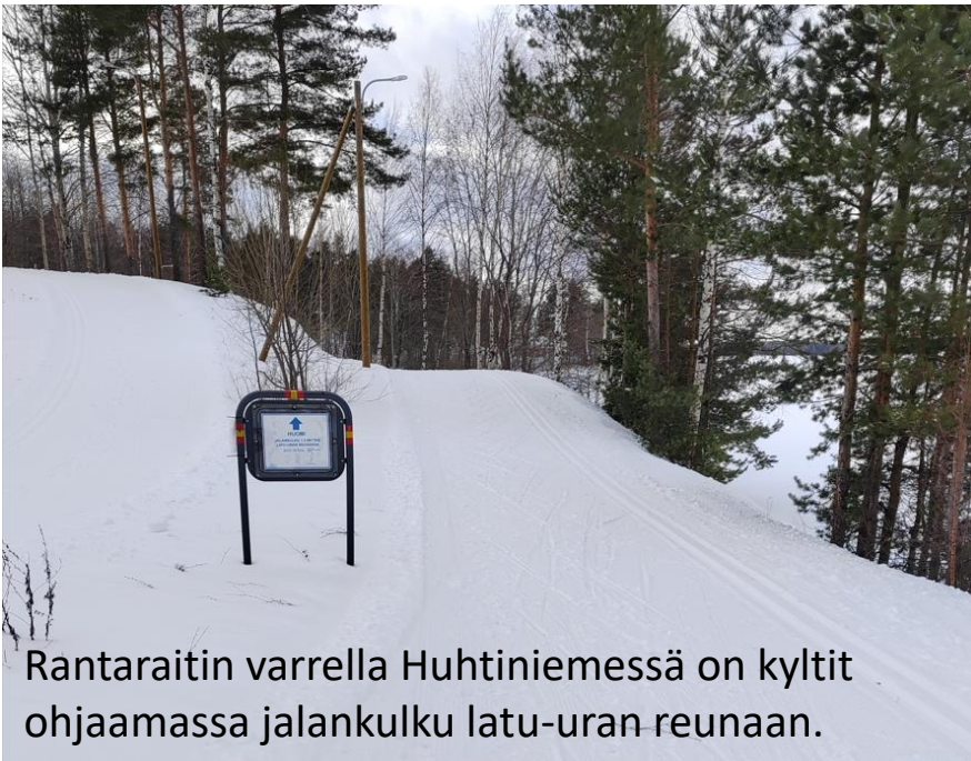
Rantaraitin varrella Huhtiniemessä on kyltit ohjaamassa jalankulku latu-uran reunaan.