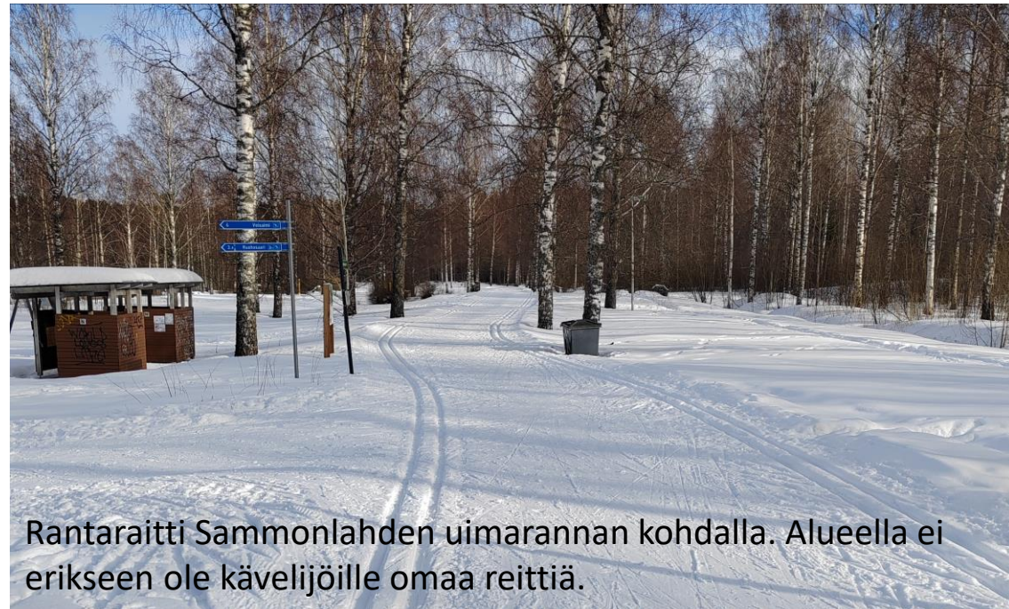
Rantaraitti Sammonlahden uimarannan kohdalla. Alueella ei erikseen ole kävelijöille omaa reittiä.